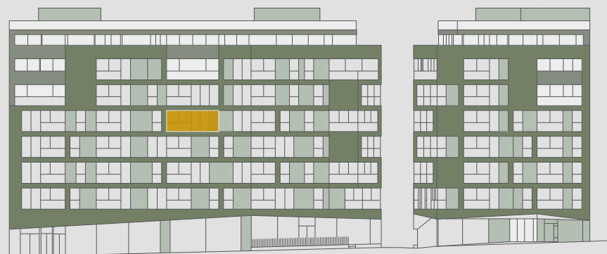
C/ PALOS DE LA FRONTERA